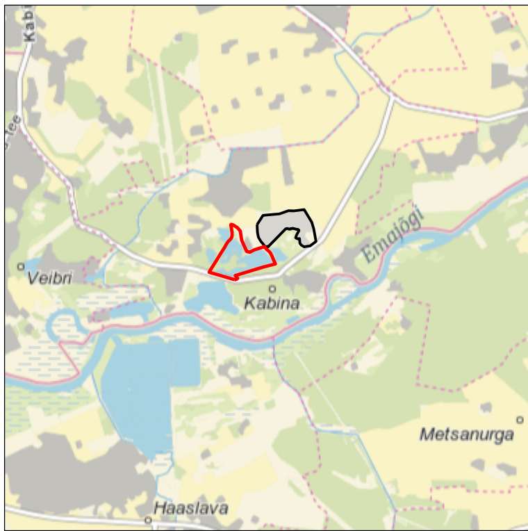
Kaardileht nr 5441 Tartu